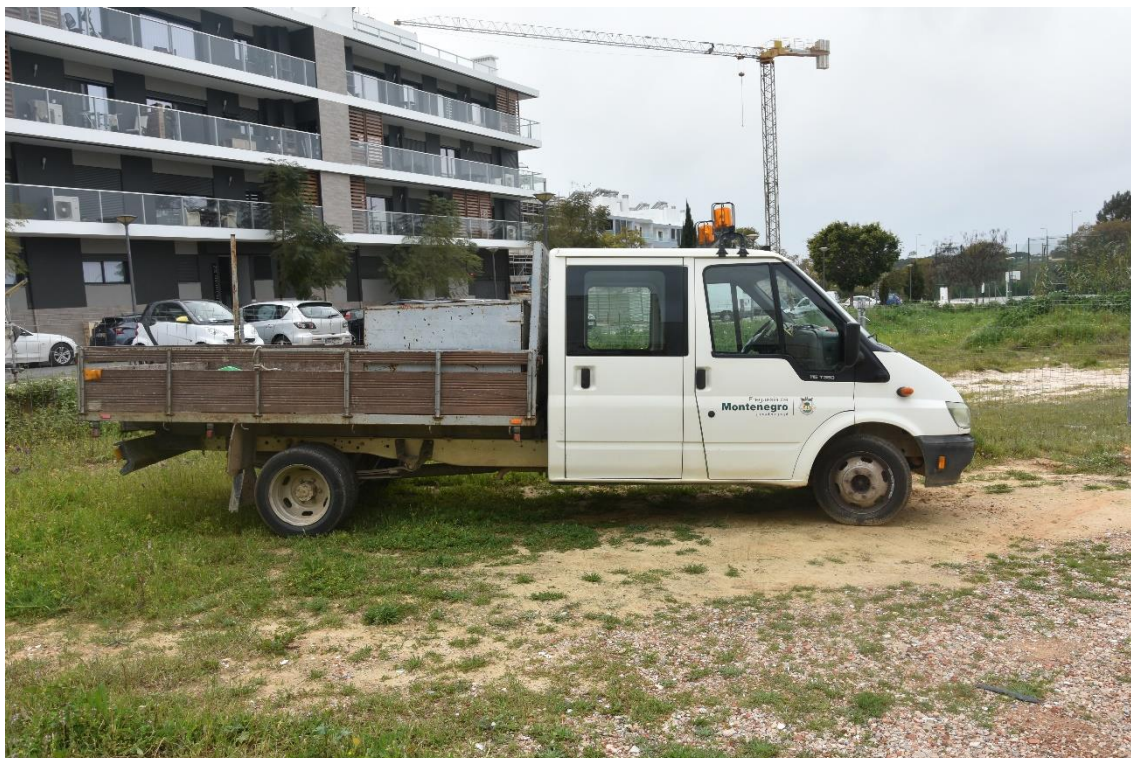
Veículo matrícula 10-32-IH